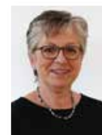
Elisabeth Binder Musikschule Hoffnungsland

Wir unterstützen durch den Verkauf der Notenmappen Hilfsprojekte für ukrainische Flüchtlinge mit 5.- EUR pro Notenmappe für Tischharfe und mit 3.- EUR pro Notenheft. Neben dem Beitrag durch den Verkauf der Notenmappen sind wir bereits an einigen Orten dabei, Kindern aus der Ukraine Musikschulunterricht zu ermöglichen und so zur Aufarbeitung und bei der Integration zu helfen.